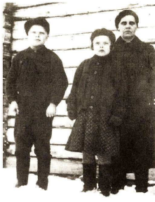
Esteri huutolaiskotiinsa kasvatettiin viereisen kuvan poika on myös kasvatti.