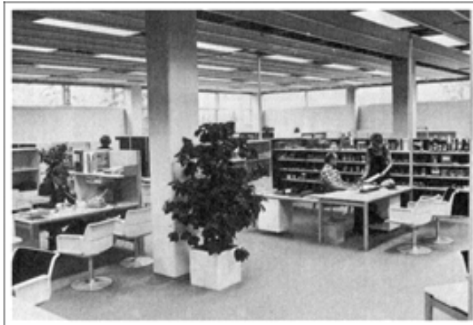
Anni keskustelemassa töistä SOK:n uudessa avokonttorissa