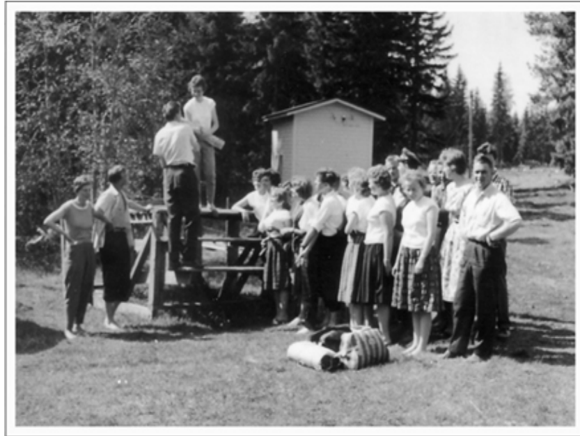
Haikea ero luokkatovereista kotikylän maitolaiturilla kauppaopiston päättäjäisiksi tehdyllä luokkaretkellä.

Työt osuustoiminnan palveluksessa alkoivat kesäkuun alussa 1960 uudessa konttorissa kassanhoitajana. Kassanhoidon lisäksi tehtäviin kuului palkkalaskenta, konekirjoitusta, tavarakirjanpitoon liittyvien asioiden hoitamista pääkonttorin reikäkorttiosastolle, reikäkorttijaoston laskutuksen tarkistamista ja erilaisia tilastotöitä. 17 Työsuhde kesti vain vajaan vuoden, kun oli aika perustaa perhe ja elämä sai uuden suunnan.