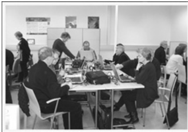
Seniorit opissa kansalaisopistolla.