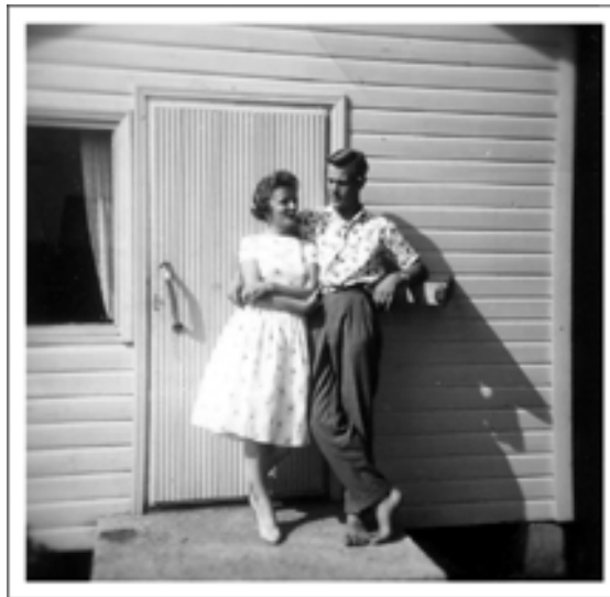
Nuoripari Annin kotiportailla

Sukupolven kertomuksissa yhteisenä kokemuksena on maansisäinen muuttoliike. Lähes jokainen on joutunut muuttamaan sekä koulutuksen että oman tai puolison työpaikan vuoksi. Kansainvälisesti ainutlaatuinen tilanne syntyi koulutusjärjestelmän ja elinkeino- ja luokkarakenteen murroksen tapahduttua samanaikaisesti. (Kauppila 1996, 90.)