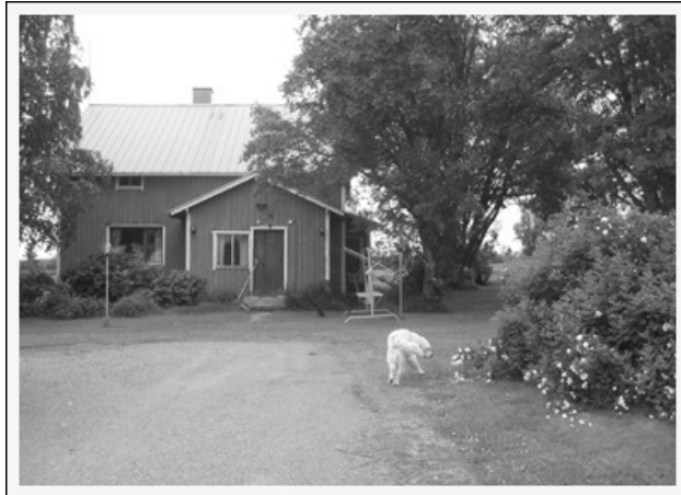
Muuttunut ja hiljentynyt kotipiha.