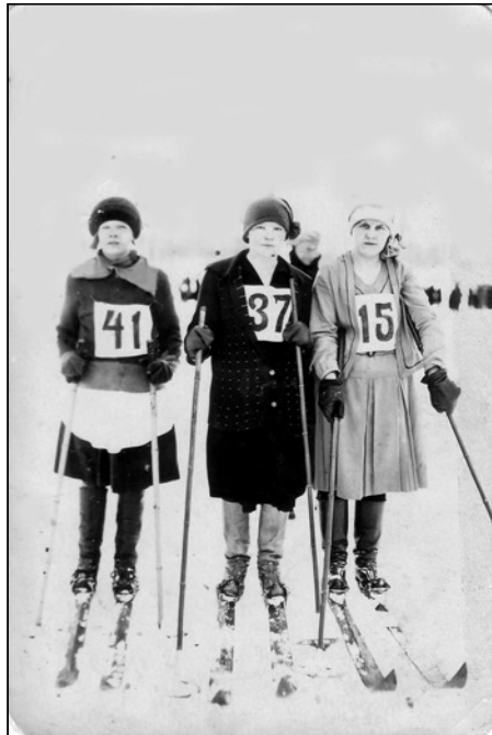
"Hamejoukkue", Annin äiti on n:o 15.